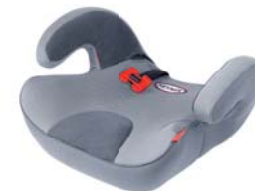
SafeUp L ERGO