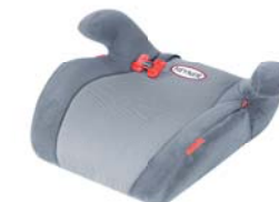
SafeUp M ERGO

In unterschiedlichen Farben erhältlich. In different colors available. Имеется в продаже разного цвета.