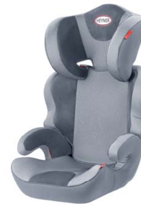
MaxiProtect ERGO SP