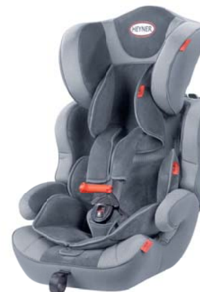
MultiProtect ERGO SP